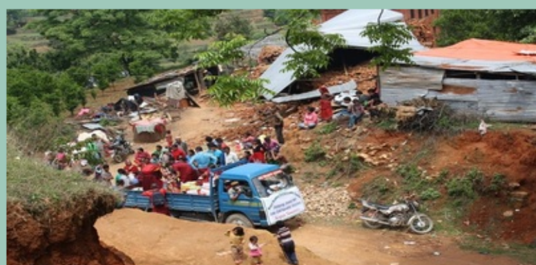
Hulp van het Kopan klooster in Nepal, in de afgelegen dorpen