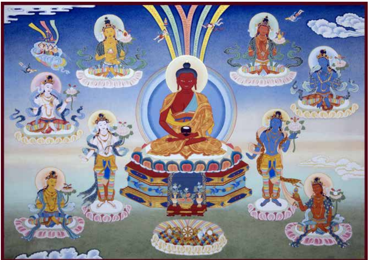
Boeddha Amitabha met 8 bodhisattva's

Na het sterven komt de bardo-staat, het “karmische” bardo (Tibetaans: sipai bardo ), dat resulteert uit eerdere levens. Deze periode is de meest belangrijke periode waarin een levende een gestorvene kan helpen. Hierna zal het toekomstige leven langzaam vorm krijgen. Het bardo is de wachtkamer waarin je uiterlijk 49 dagen kunt verblijven alvorens een nieuw leven te beginnen. Ons bewustzijn is nu vele malen intensiever dan tijdens het voorbije leven. Wanneer ons gewoontepatroon in het leven positief was zullen onze waarneming en ervaring in het bardo die van